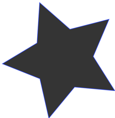
Slika 2: Zvezda (format PNG).